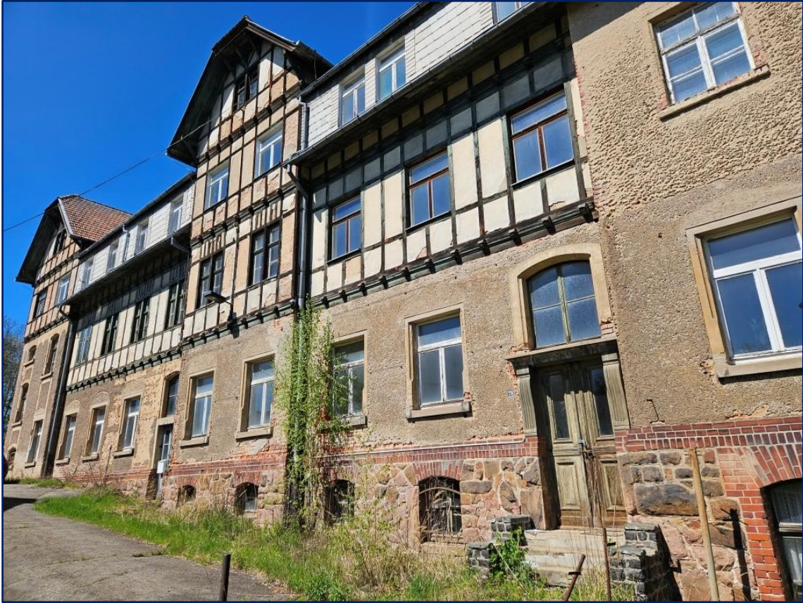
Gebäude Südseite | Blickrichtung West