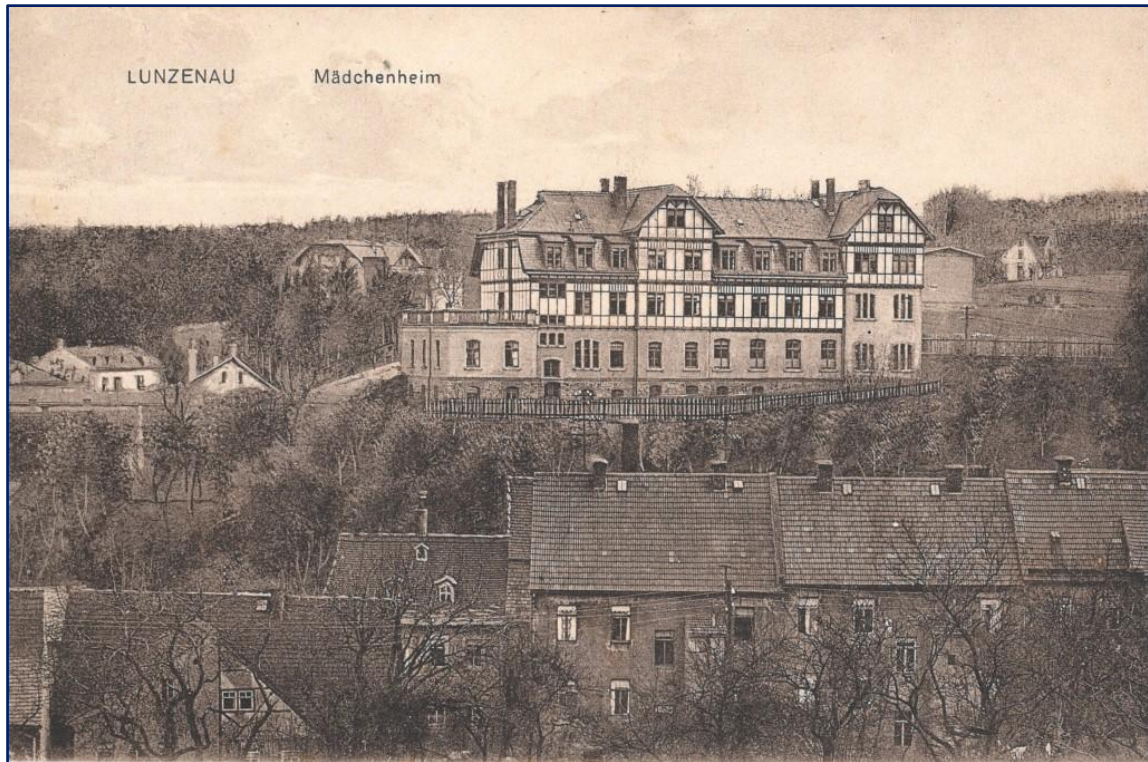
Postkarte von 1916