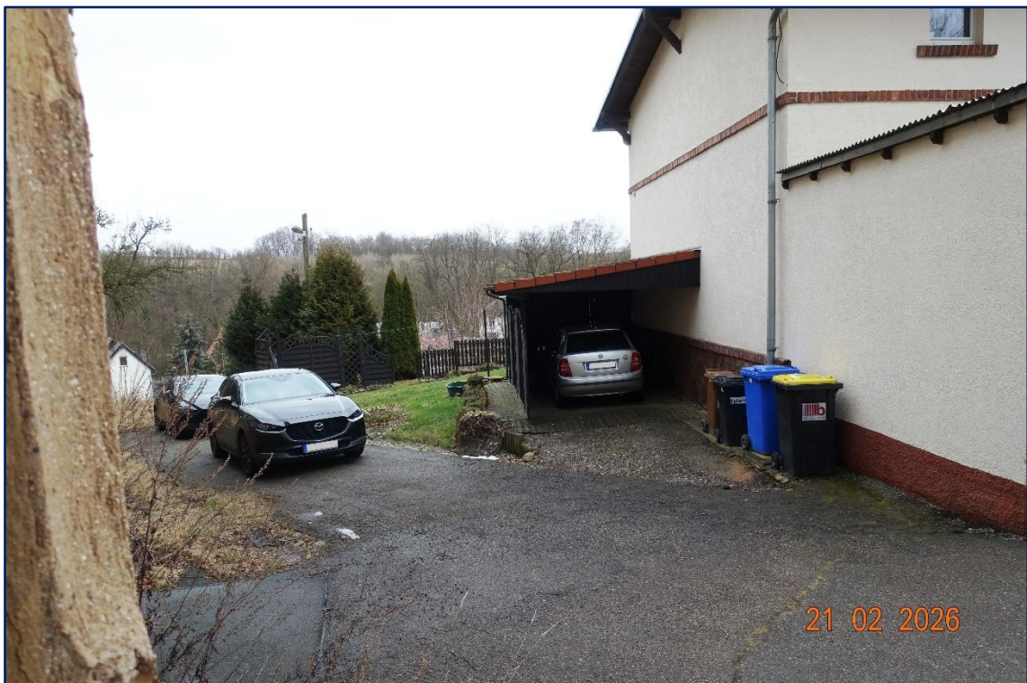
Gebäude Südseite | Blickrichtung Ost