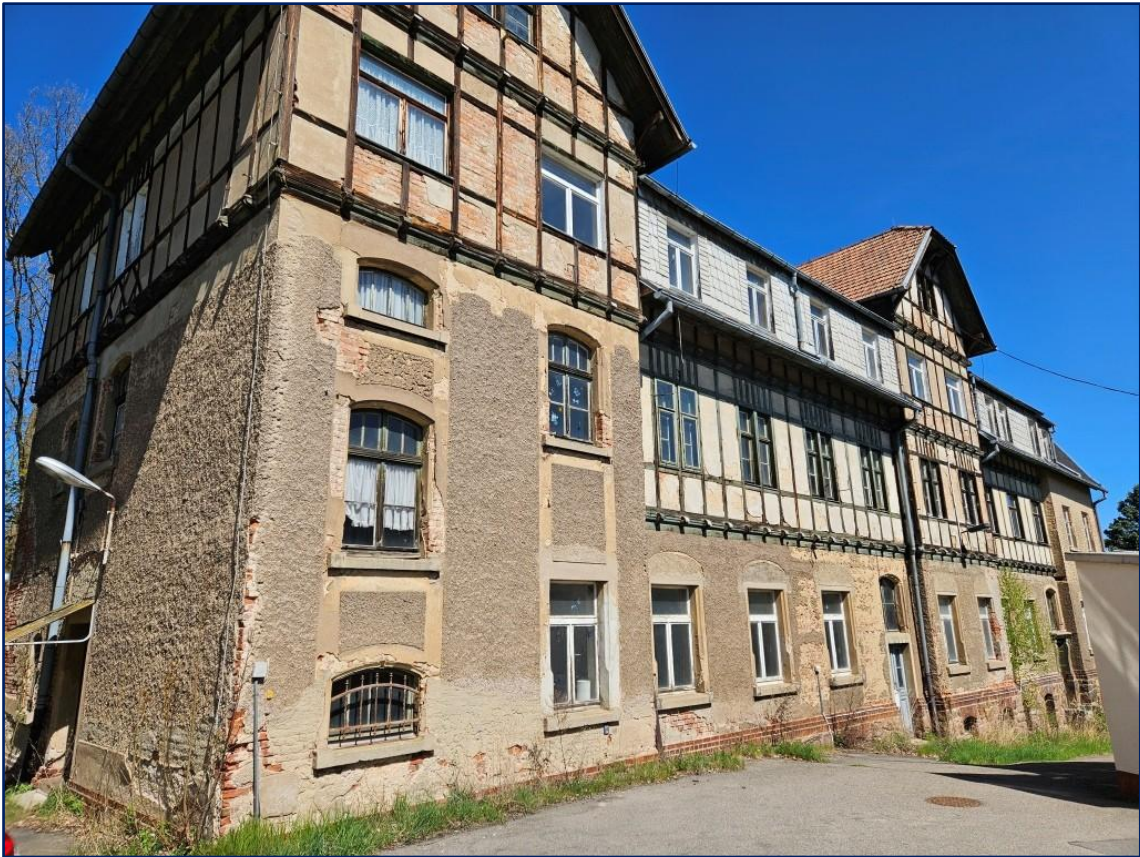
Gebäude Westseite und Südseite