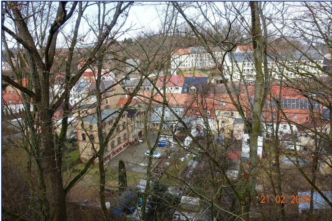
Blick nach Nord - über den Dächern von Lunzenau