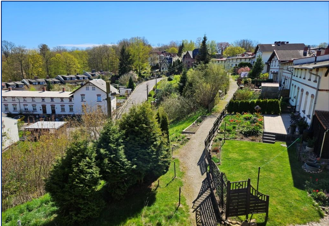
Blick in die direkte Nachbarschaft nach Süden Im Sommer ist es hier wunderbar grün und die gepflegten Gärten blühen.