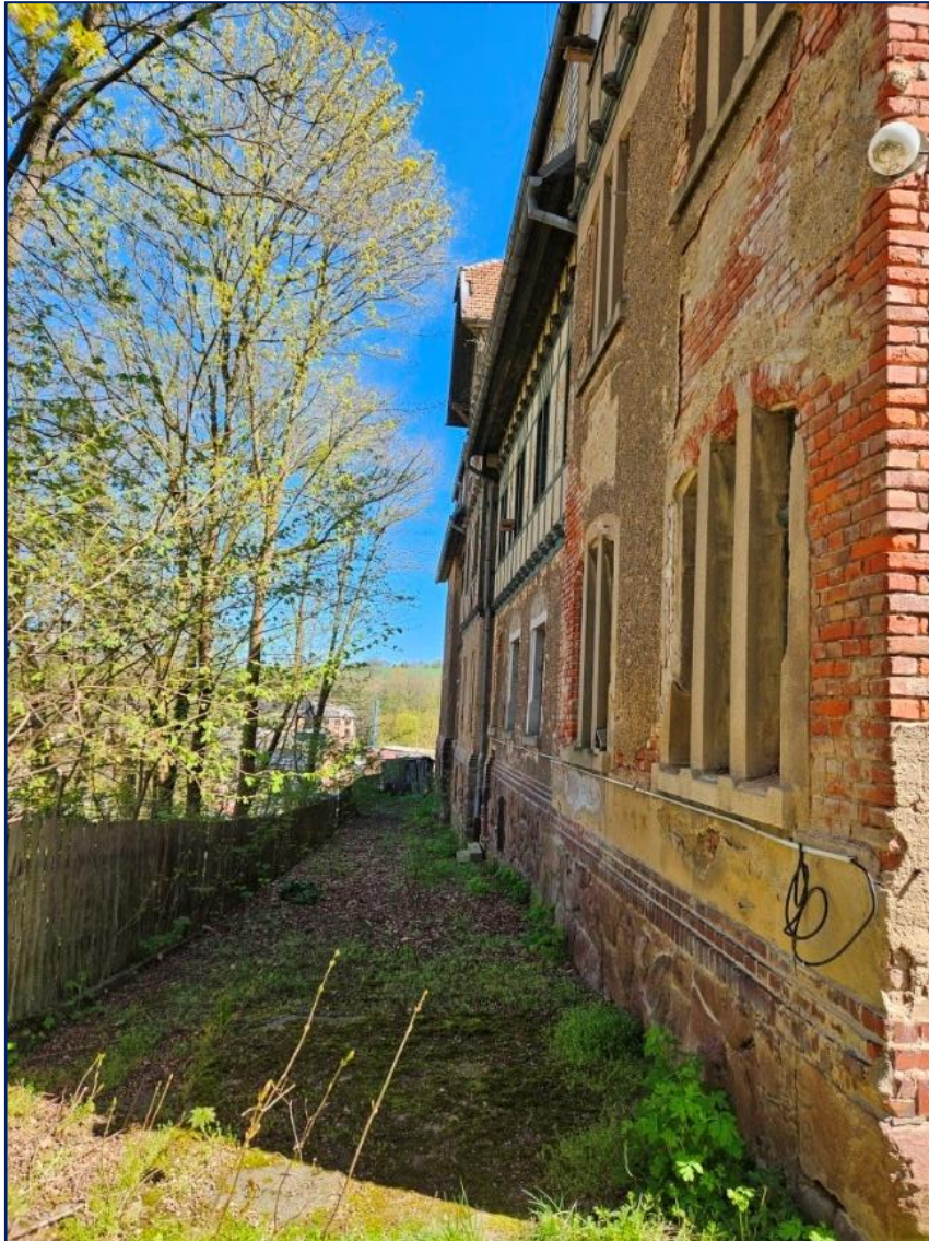
Gebäude Nordseite | Blickrichtung Ost