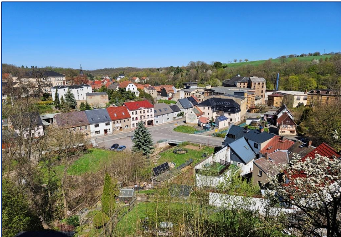
Blick nach Nord-Ost | Richtung Zentrum