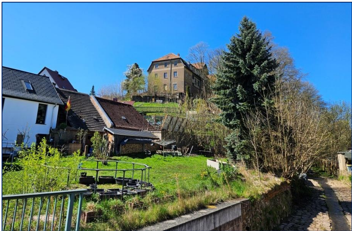
Anfahrt aus dem Zentrum