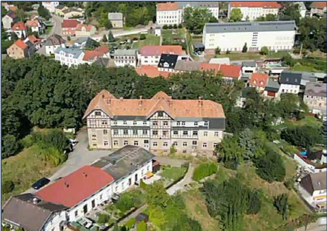
Bald erstrahlt dieses wunderschöne Gründerzeit-Fachwerkanwesen wieder in alter Pracht