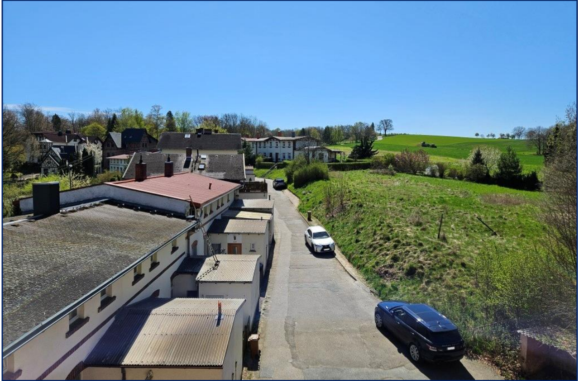
Freier Blick nach Süden in die Zufahrt und ins Grüne