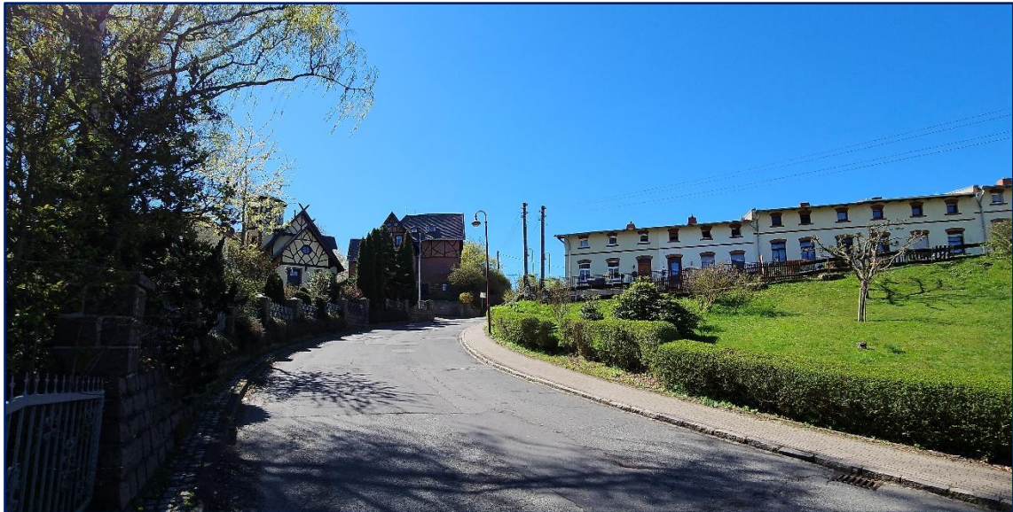
Anfahrt aus dem Zentrum