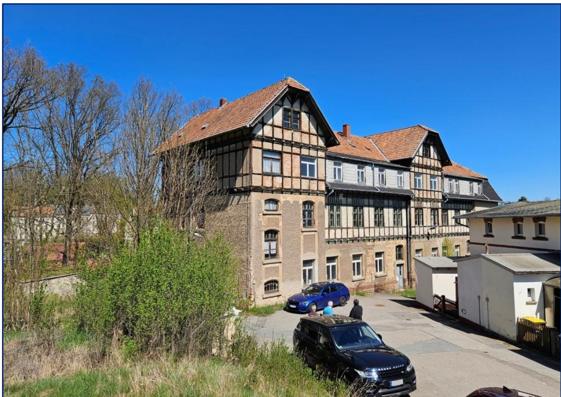
Bald erstrahlt dieses wunderschöne Gründerzeit-Fachwerkanwesen wieder in alter Pracht