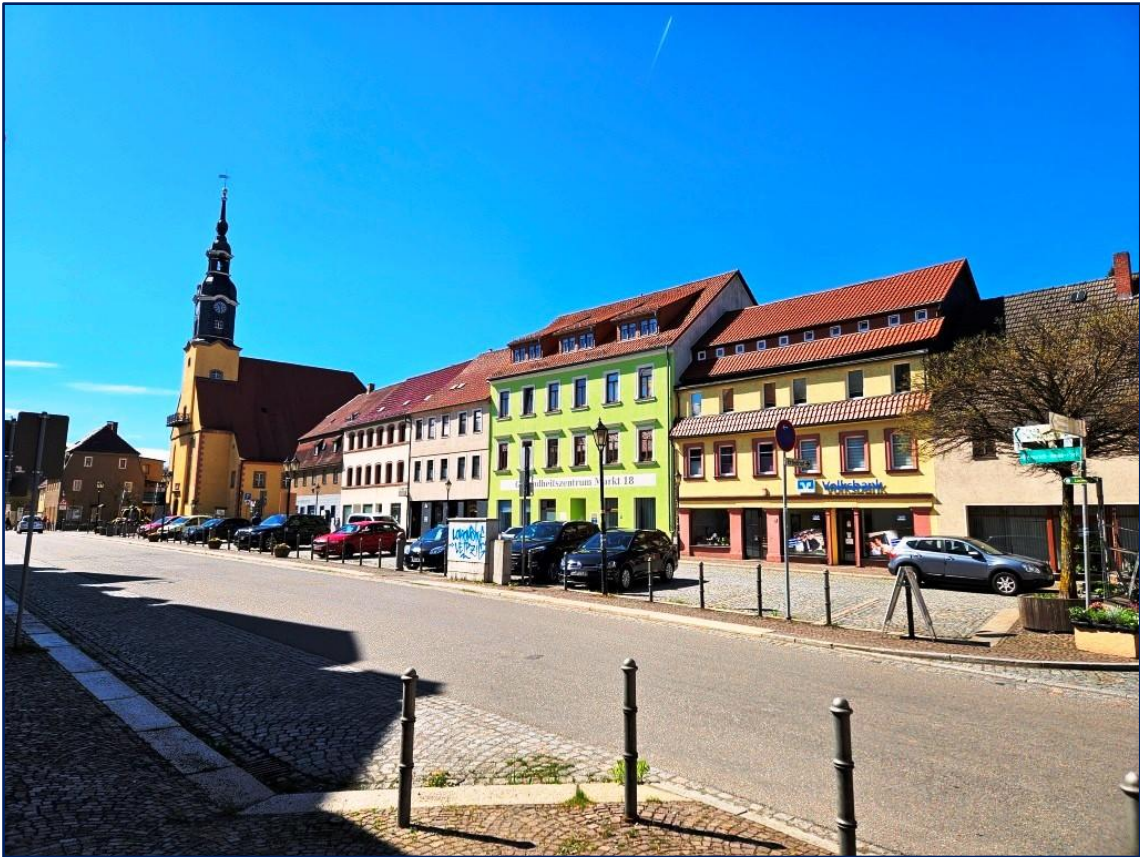
Der idyllische Marktplatz lädt zum Verweilen ein