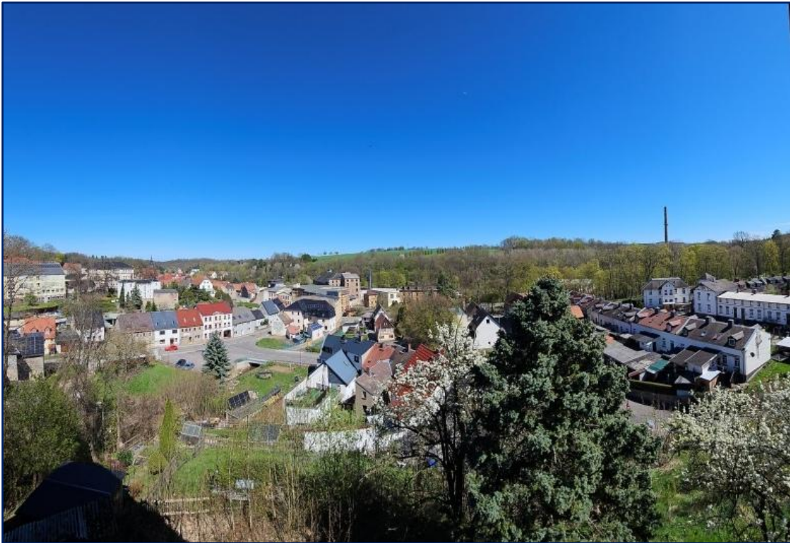
Blick nach Ost-Nord-Ost | Richtung Zentrum