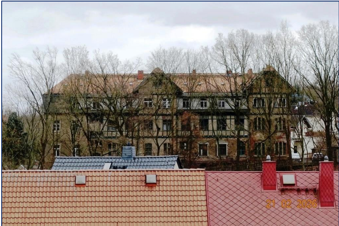
Über den Dächern von Lunzenau thront das Gebäude in herrschaftlicher Lage