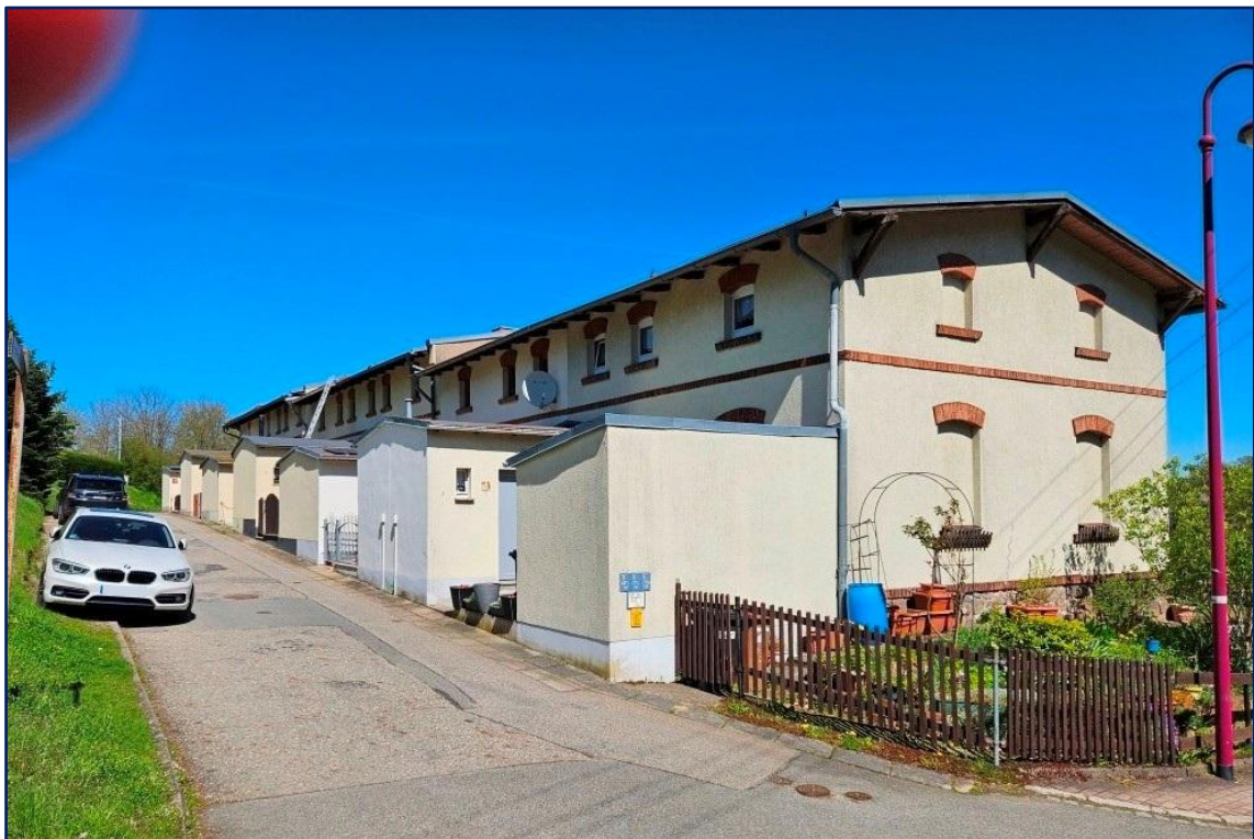
In der Zufahrt befinden sich Einfamilienhäuser mit tollem Blick Richtung Zentrum und schönen Gärten