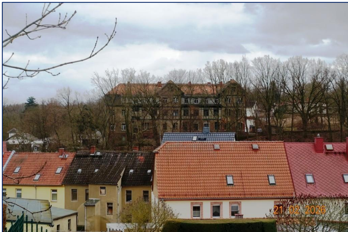
Über den Dächern von Lunzenau thront das Gebäude in herrschaftlicher Lage