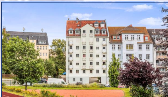
Herzlich willkommen | Straßenansicht Scholtzstraße

Attraktive Kapitalanlage-Wohnungen als Teileigentum in 08523 Plauen-Mitte