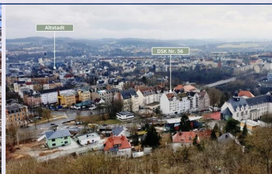
zentrumsnah und ruhig gelegen