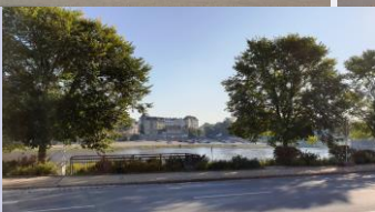
Ausblick Vorderseite Elbblick