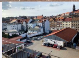
Ausblick Hofseite (Lidl)